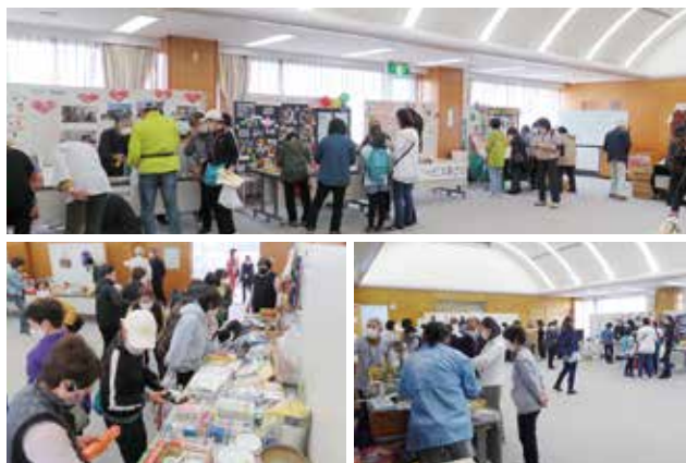
令和5年開催の様子