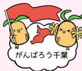
千葉県共同募金会 マスコット「びわびよ」