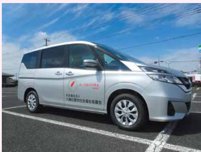
地域福祉事業用車両(赤い羽根共同募金)

地域福祉事業用車両が交付されました。 赤い羽根共同募金助成車両 千葉県共同募金会より、地域福祉事業用車両として、日産セレナ(8人乗り)が配備されました。 共同募金の助成は、高齢者サロンの運営やボランティア活動、障がい者施設の車の整備、社会福祉施設の改修まで、さまざまな民間社会福祉活動を支援しています。 車両は、指定管理で受託している福祉作業所のイベントでの利用者の送迎や共同募金活動など、様々な福祉活動に活用します。