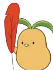
千葉県共同募金会 マスコット 「びわびよ」

共同募金会は、指定寄付金の対象となる数少ない団体のひとつです。 また、個人による寄付も、所得控除または税額控除の適用を受けられます。