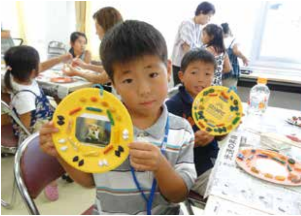
マカロニでリース作り(十日会)

市ボランティア連絡協議会が主催する“夏休みボランティア体験教室”は、ボランティアに興味をもってもらい、気軽に楽しく参加するきっかけづくりを目的としています。