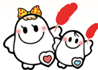
愛ちゃんと 希望くん

10月1日から全国一斉に赤い羽根共同募金運動がスタートします。大網白里市社会福祉協議会では、千葉県共同募金会大網白里市支会として、今年も戸別募金・企業・個人商店等募金・街頭募金・職域募金・学校募金など様々な運動を展開していきます。