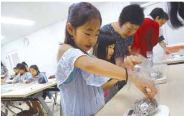
プルトップの計量(市ボランティア連絡協議会)