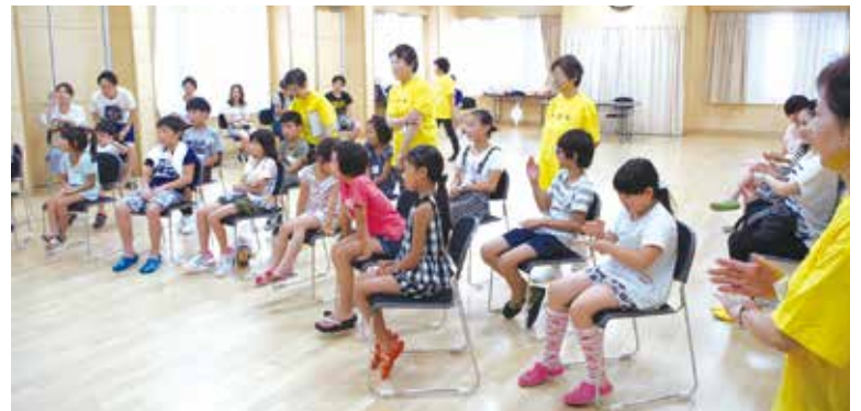
手話を学ぶ(手話サークル歩み)