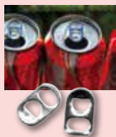
アルミ缶の プルトップのみ取る。