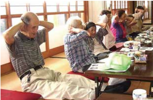
ゆうゆうサロン浜宿“健康体操”

高齢者が地域の中で仲間づくりや生きがいを得ることができるよう社会福祉協議会では、「ふれあいいきいきサロン」を各区・自治会に一つずつ設置していくことを目標に各支部と取り組んでいます。