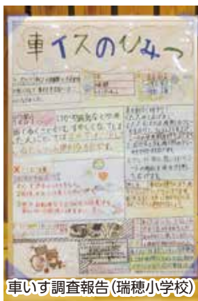
車いす調査報告 (瑞穂小学校)

特に地域の方と取り組んだ授業では、ふれあいや関わりを重点に取り組んできたことで、児童は自分自身を振り返ったり、真剣に考えたりする場面が幾度とみられ、学習が有効なものでした。