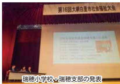
瑞穂小学校・瑞穂支部の発表

5つの地区にある社会福祉協議会支部とそれぞれの地区の小学校、中学校と連携し福祉教育をすすめていただいています。