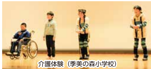
介護体験 (季美の森小学校)

ました。子育て世代と高齢者世代が混在する季美の森地区において、異世代間の交流は、さらに必要になってきます。