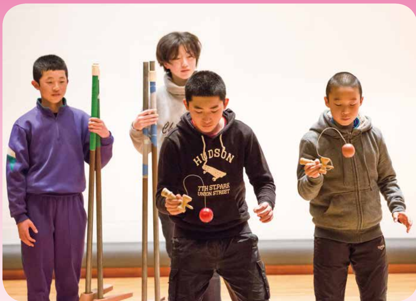
大網白里市社会福祉大会 福祉教育活動発表 昔遊び (季美の森小学校)

発行 社会福祉法人 大網白里市社会福祉協議会 大網白里市大網 131-2 電話 0475-72-1995 FAX 0475-72-1996 E-mail: mail@oamishakyo.com ホームページ: http://www.oamishakyo.com