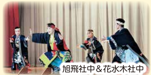
旭飛社中&花水木社中