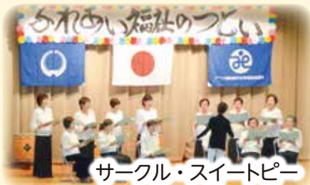
サークル・スイートピー