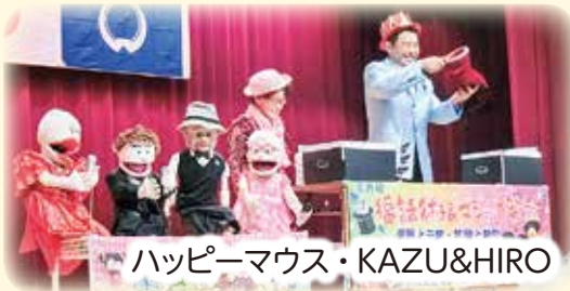
ハッピーマウス・KAZU&HIRO