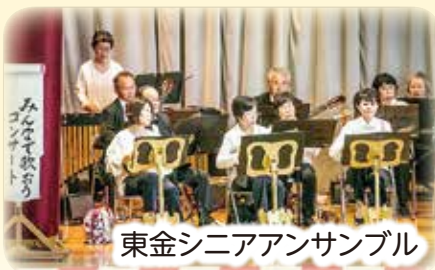
東金シニアアンサンブル