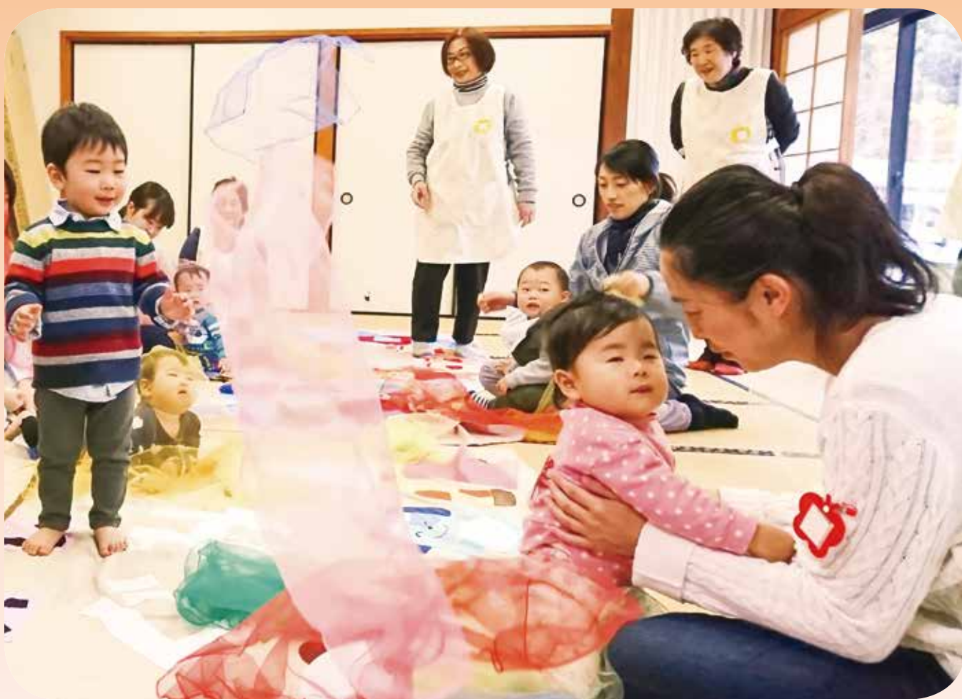
子育てサロン (のびのびひろば)

発行 社会福祉法人 大網白里市社会福祉協議会 大網白里市大網 131-2 電話 0475-72-1995 FAX 0475-72-1996 E-mail: mail@oamishakyo.com ホームページ: http://www.oamishakyo.com