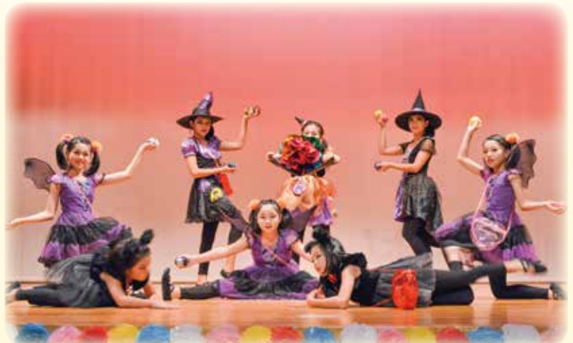
キッズダンス・パステルズ