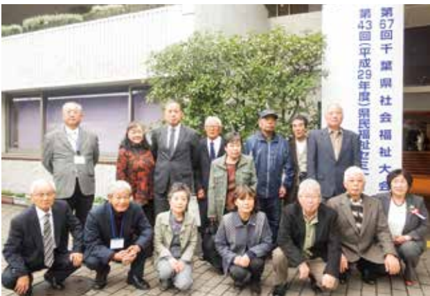
千葉県社会福祉大会 (千葉県文化会館)