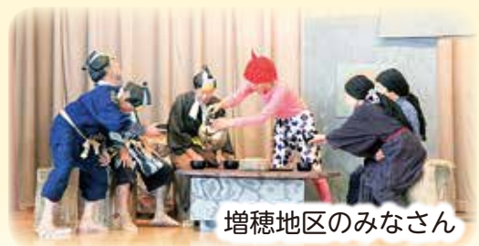
増穂地区のみなさん