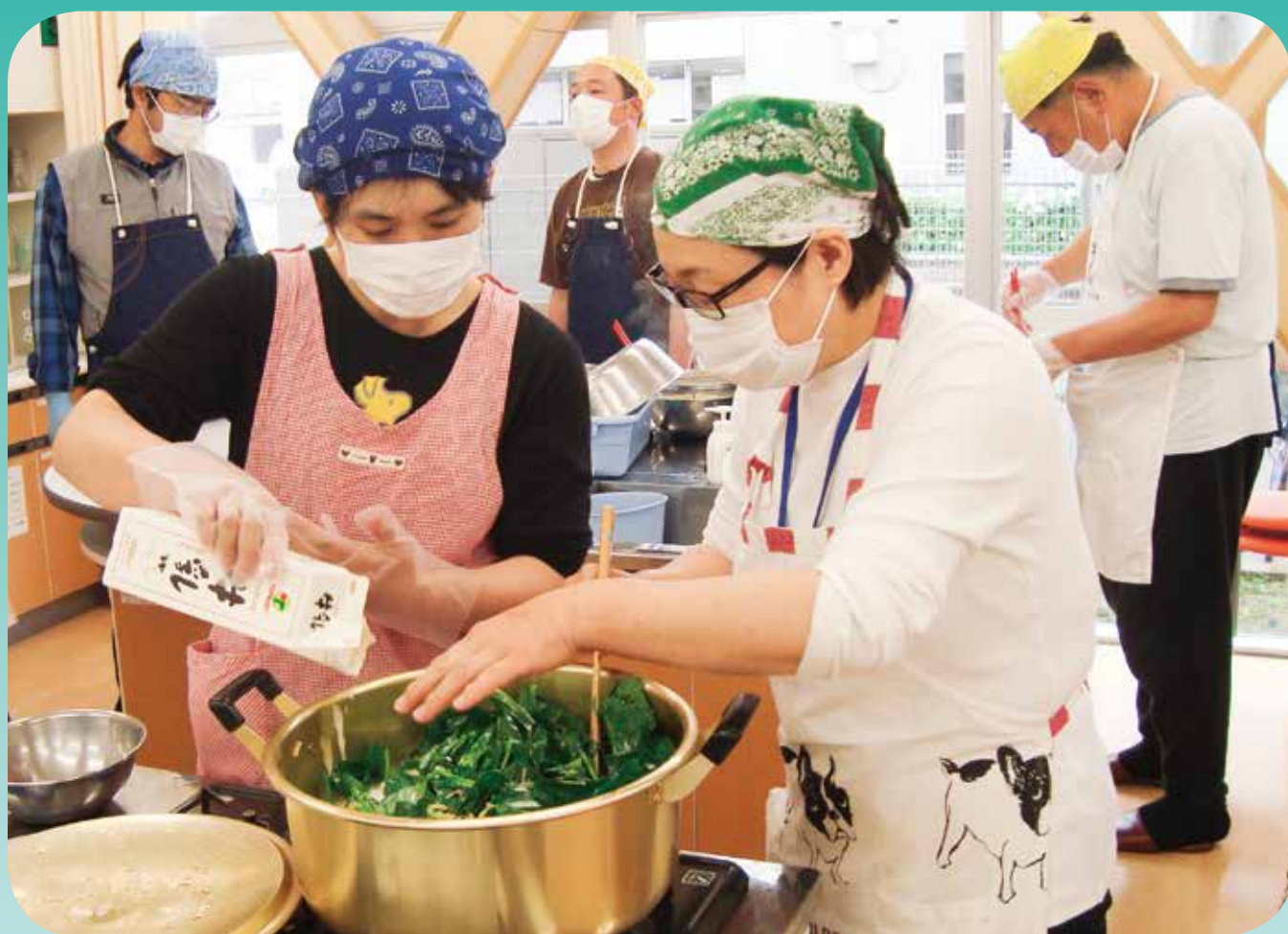
調理実習（福祉作業所）

平成28年度社会福祉協議会事業報告・収支決算報告 夏休みボランティア体験教室が始まります！ ささえあいのまちづくりフォーラムに参加しよう！