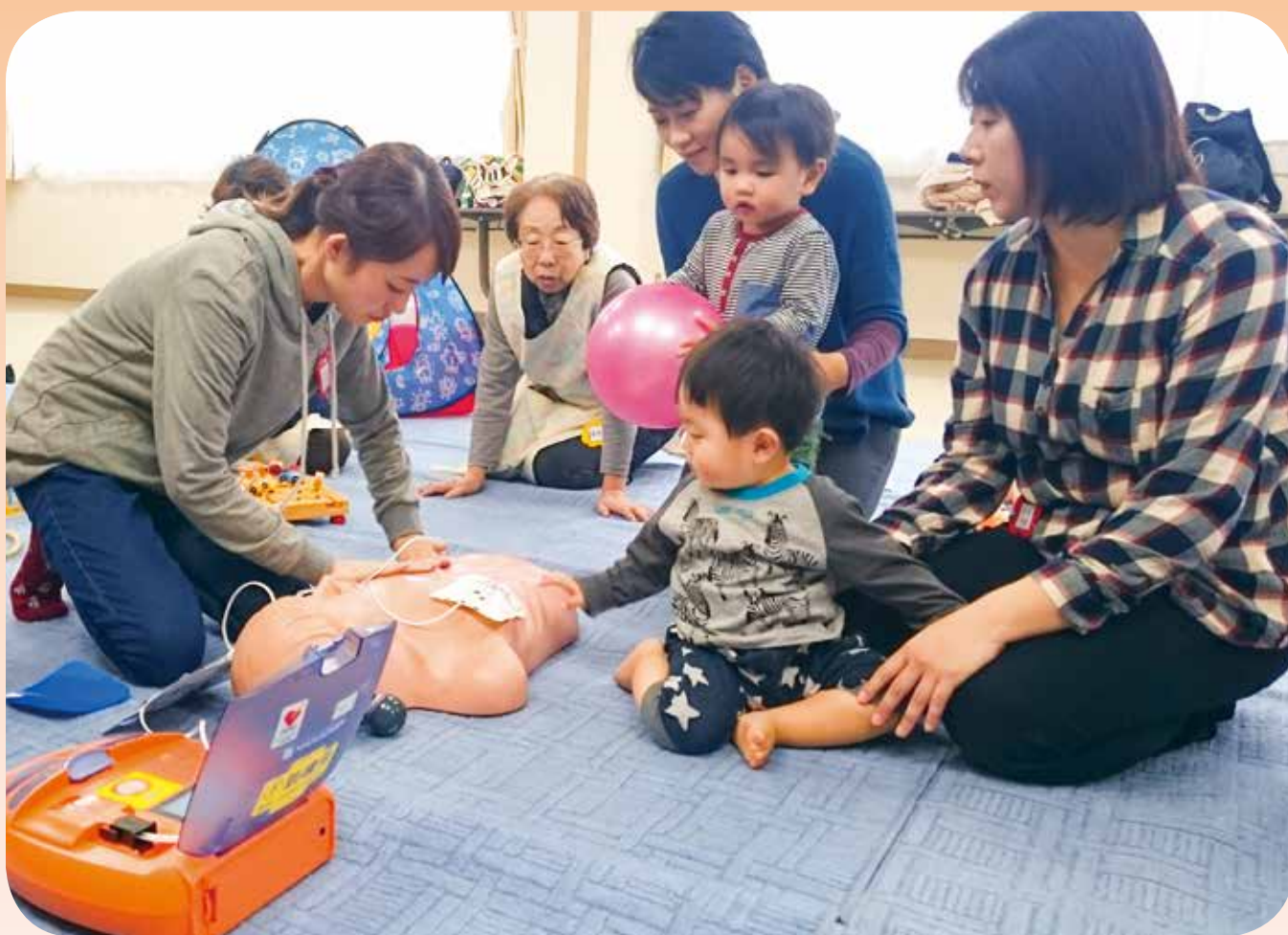
幼児の応急処置（くすくすひろば）

発行 社会福祉法人 大網白里市社会福祉協議会 大網白里市大網 131-2 電話 0475-72-1995 FAX 0475-72-1996 E-mail: mail@oamishakyo.com ホームページ: http://www.oamishakyo.com