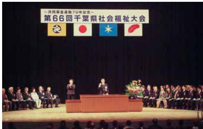
千葉県社会福祉大会の式典