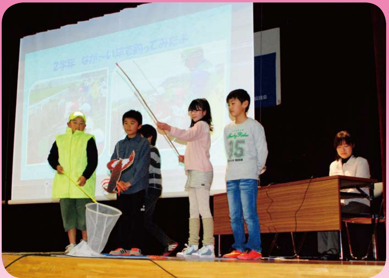
福祉教育活動発表（大網小学校）

社会福祉法人 大網白里市社会福祉協議会 大網白里市大網131-2 電話 72-1995 FAX 72-1996 E-mail: mail@oamishakyo.com ホームページ: http://www.oamishakyo.com