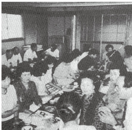
地域活動についての講演会(昭和61年)

現在、記念誌制作の計画が進められています。歴史を辿るとともに次代へつなぐメッセージを発信できればと願っています。