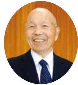
大網白里市 社会福祉協議会