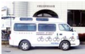
活躍する福祉車両「競輪号」