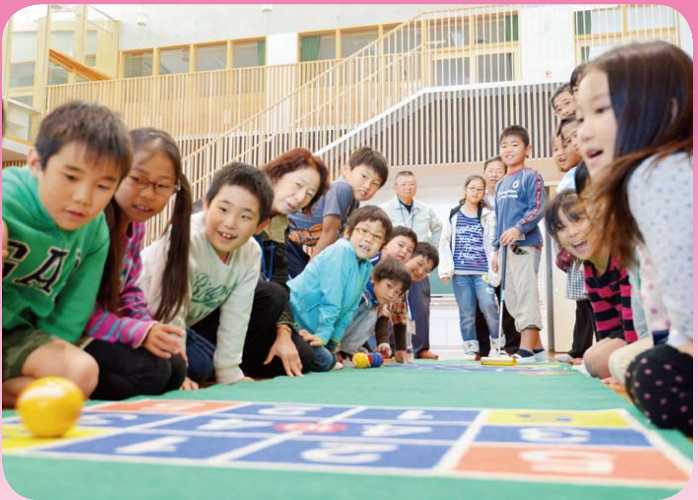
福祉教育 交流会（大網小学校と大網支部）

社会福祉法人 大網白里市社会福祉協議会 大網白里市大網 131-2 電話 72-1995 FAX 72-1996 E-mail: mail@oamishakyo.com ホームページ: http://www.oamishakyo.com