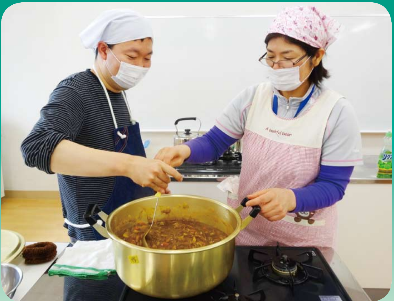
調理実習【福祉作業所】

社会福祉法人 大網白里市社会福祉協議会 大網白里市大網131-2 電話 72-1995 FAX 72-1996 E-mail: mail@oamishakyo.com ホームページ: http://oamishakyo.com