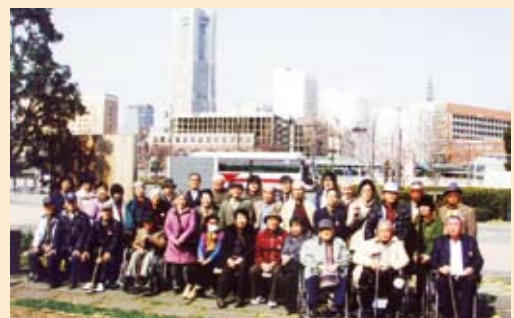
今年春の旅行/横浜赤レンガ倉庫