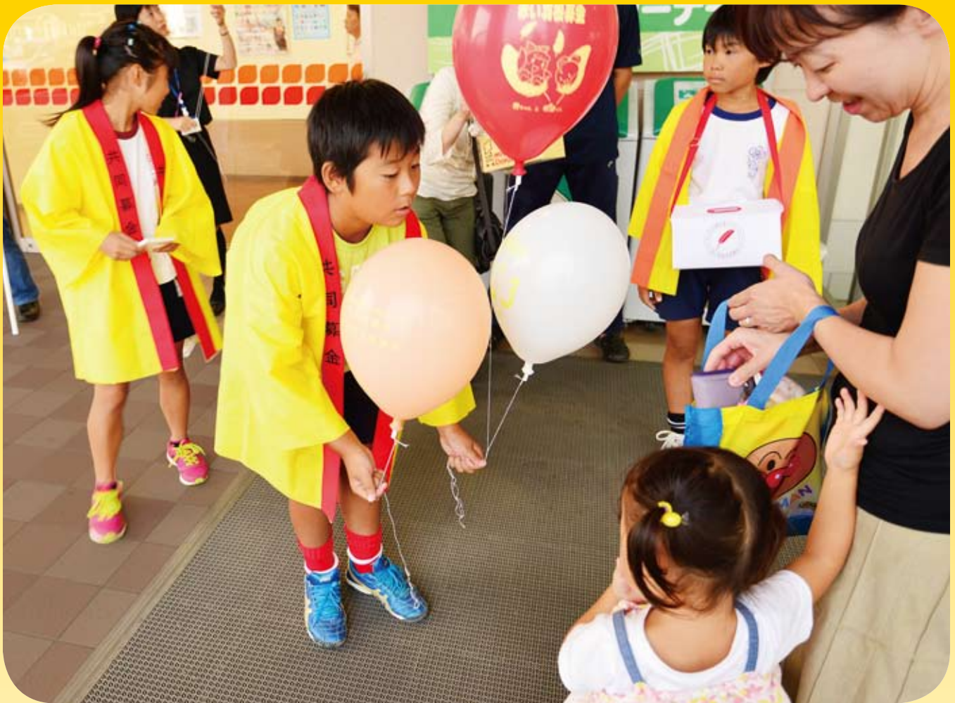
街頭募金（赤い羽根共同募金運動）

社会福祉法人 大網白里市社会福祉協議会 大網白里市大網131-2 電話 72-1995 番 FAX 72-1996 番 E-mail: mail@oamishakyo.com ホームページ: http://oamishakyo.com