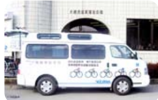
活躍する福祉車両「競輪号」