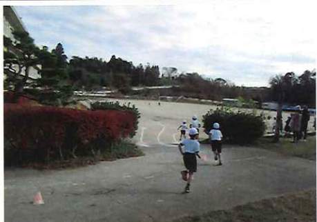
白幡小マラソン大会