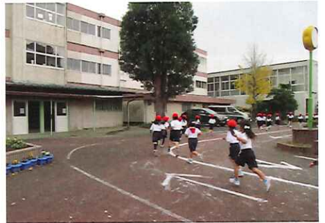
辰巳台東小マラソン大会