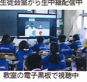
生徒会室から生中継配信