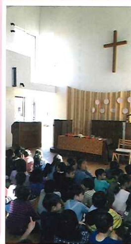
新教会堂と光の子幼稚園

光の子幼稚園に隣接して、京葉中部教会の新会堂が新築されました。皆様はもうご覧になられたでしょうか？ ガルバリウムと木を組み合わせたお洒落な外観ですが、礼拝堂と三つの集会室の内部に植えられたモミの木は、クリスマスの飾り付けを待っています。会堂は、日曜日の礼拝の他に、園児たちの収穫感謝祭などの礼拝にも用いられますが、コンセプトは外に開かれた教会です。平日は、町のシニアの方々の「ほっと