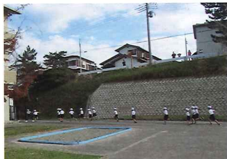
辰巳台西小マラソン大会