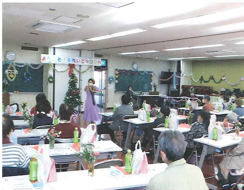
ふれあいいきいきサロンも感染予防対策をして (南総公民館)