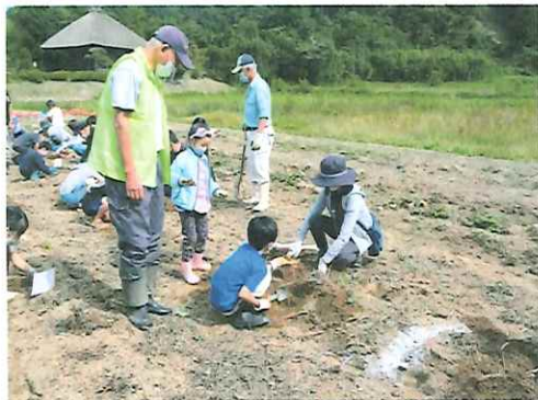
子ども部会の芋掘り大会