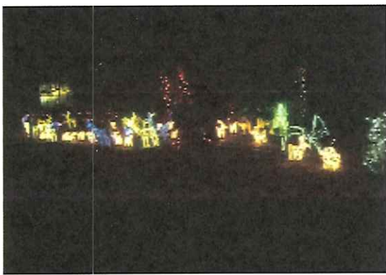
上総鶴舞駅のイルミネーション