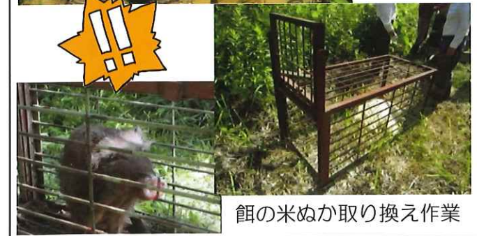
餌の米ぬか取り換え作業