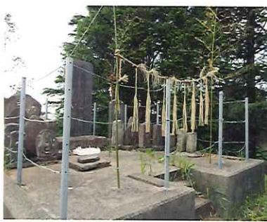
三山公園頂上にある石碑群

その方々(行人、ぎょうにん)は登拝記念碑を建てましたが、大蔵の行人も、集落の南に広がる辰巳ヶ原の随所に建てた(供養塚)。辰巳台団地造成に伴いそれらの処遇に困惑していたところ、造成当局は、大蔵の厚い信仰心を配慮し、大きな供養塚のあった現三山公園の一面を大蔵町会に提供。この結果石垣の最上段には、大小18基の碑(最古は約300年前)が安置され、今でも毎年7月、祭礼が行われています。由緒ある場所があるというところは町会の大きな誇りで、近頃の皆さんは、日頃外回りを清掃して公園美化に貢献しています。